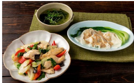
3/7（土）[糖質15.6g：野菜量約160g] 鶏ささみとセロリの塩炒め ゆでワントンのごまだれがけ わかめスープ