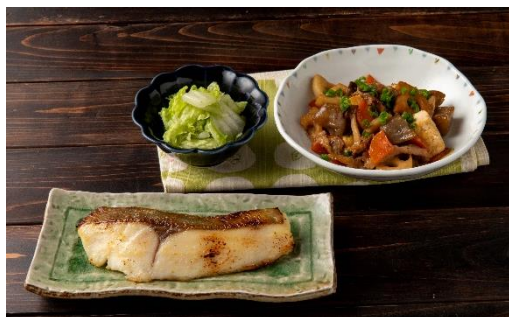
3/3（火）[糖質22.2g：野菜量約120g] 白ひらす西京漬焼き 五目けんちん煮 ゆず香あえ