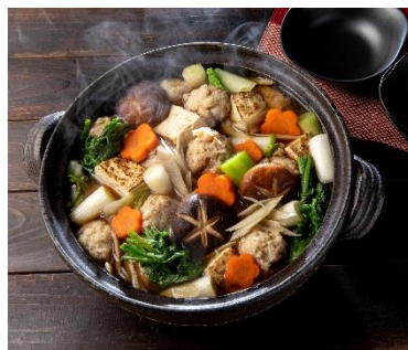
3/6（金） [糖質23.4g：野菜量約230g] まぐろつみれのねぎま鍋